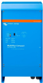
MultiPlus Compact 12/2000/80

Y hay disponible un sofisticado software (VE.Bus Quick Configure y VE.Bus System Configurator) para configurar varias nuevas y avanzadas características.